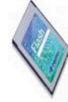
Linear Flash Series 5