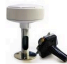
RK-104 GPS-Repeater, 10m